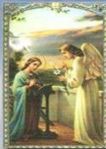
SAN GABRIEL arcángel.

Derrama señor tus gracias en nuestros corazones,, para que así como por el anuncio del ángel conocimos la encarnación del verbo, por medio de tu pasión y tu cruz, podamos alcanzar la gloria de la resurrección. Por nuestro Señor Jesucristo. Amén.