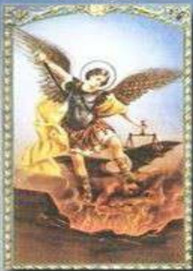
SAN MIGUEL arcángel.

Glorioso Arcángel San Miguel, primer ministro del altísimo, Príncipe supremo de las milicias de los ángeles, poderisísimo protector del catolicismo, enemigo poderoso de la culpa y herejía, sustentáculo de la fe católica, yo os suplico humildemente consigamos por vuestra intercesión los bienes espirituales y corporales que os pedimos, si han de ser para mayor honra y gloria de Dios y salvación de nuestras almas. Amén.