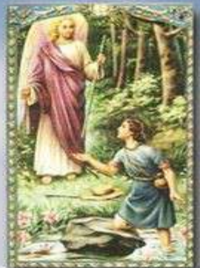
SAN RAFAEL arcángel.

Glorioso San Rafael, medicina de Dios, que guiaste a Tobías en su largo viaje, lo acompañaste en su matrimonio, y le devolviste la vista a su padre, guíanos también a nosotros en el camino de nuestra salvación, bendice nuestros hogares y cura nuestros males. Por Jesucristo, nuestro señor. Amén.